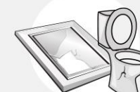
BRICOLAGE & SANITAIRE