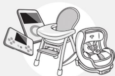
JOUETS & PUERICULTURE