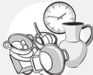
VAISSELLE & DÉCO