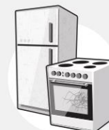
GROS APPAREILS ÉLECTROMÉNAGERS