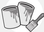
POTS DE PEINTURE OU DE VERNIS