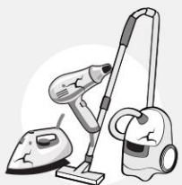
PETITS APPAREILS ÉLECTRIQUES