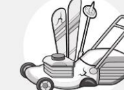
SPORT & JARDIN

Ces déchets dangereux doivent être déposés en déchèterie ou sur votre lieu d'achat de nouveaux équipements. Ces déchets contiennent des métaux lourds (plomb, mercure...), à ce titre ils sont valorisés et/ou éliminés par des filières agréées.