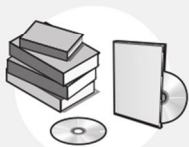
LIVRES, CD & DVD