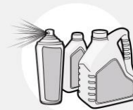
PRODUITS CHIMIQUES EMBALLÉS