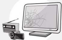
AUDIO & VIDÉO