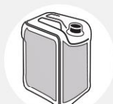
BIDONS DE PÉTROLE