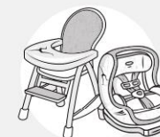
ÉQUIPEMENT DE PUÉRICULTURE